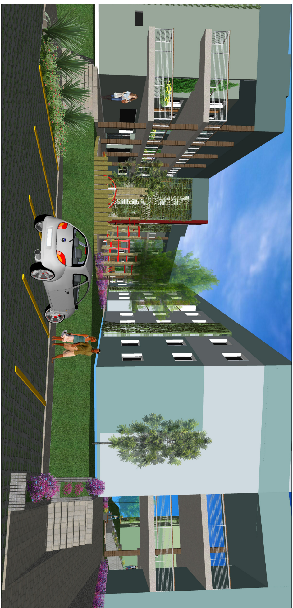
Acesso do estacionamento descoberto ao prédio 03.