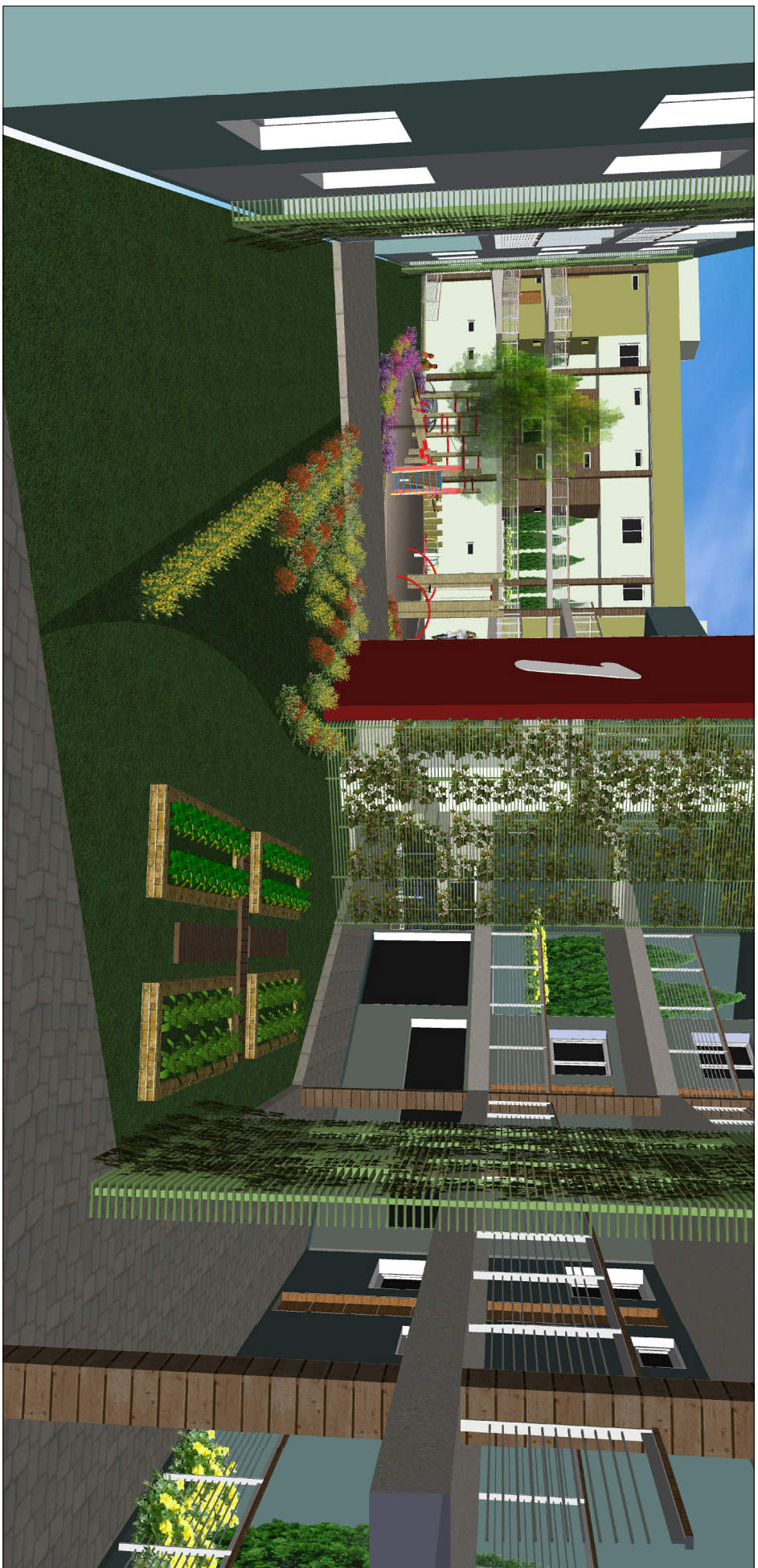
Espaço localizado próximo ao salão de festas que tem conexão com o estacionamento do prédio 04.

PRÉDIO 4: EDIFÍCIO MISTO 1 ÁREA TOTAL: 3.572,30 m² NÚMERO DE APÓS: 35 POPULAÇÃO: 123 habitantes CONSUMO DE ÁGUA: 18450 l