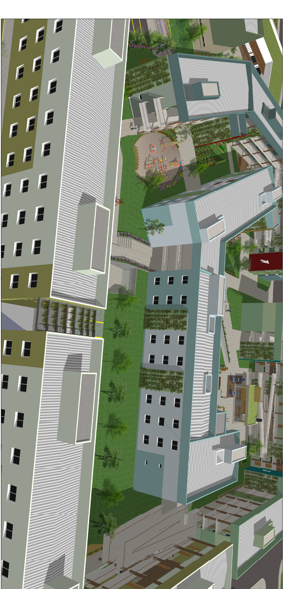
Estacionamento descoberto localizado entre os prédios 3 e 4.