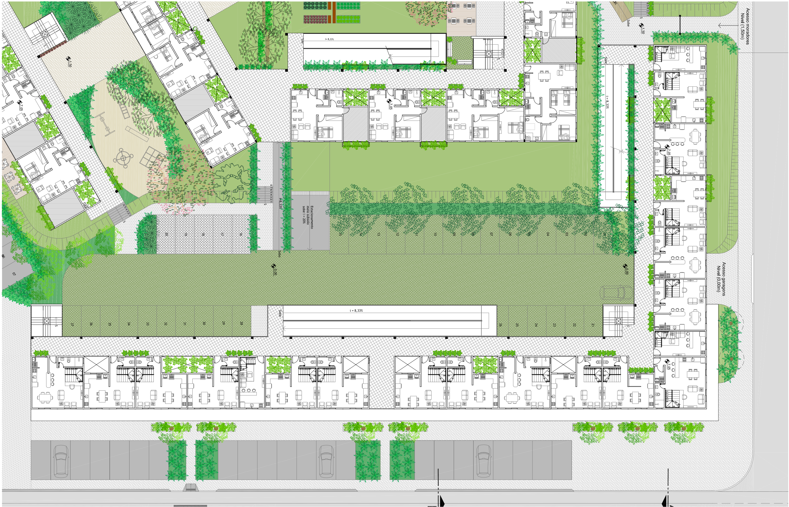
PLANTA BAIXA - 3º PAVIMENTO ESCALA: 1:250